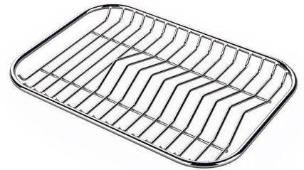
Grille porte-assiettes inox ne peut être utilisé qu'en combinaison avec les accessoires 8644 003