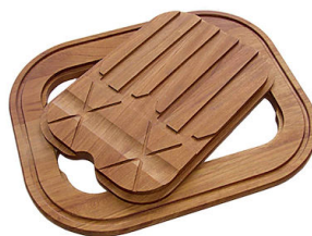
Planche de découpe Twin en bois Iroko